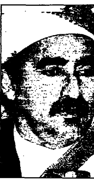
الشيخ عبد الله الاحمر

الشيخ عبد الله الاحمر.. زعيم قبلي على رأس حزب اسلامي. وقال مسؤولون من السعودية انهم يتوقعون ان تحضر اسرائيل المؤتمر الاقتصادي المنعقد في الدوحة.